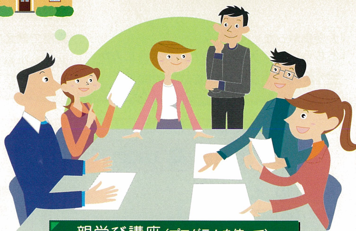
親学び講座（プログラムを使って）

企業等に勤める親等を対象に家庭教育に関する事業を 企業内で実施する場合、その経費の一部を補助します。