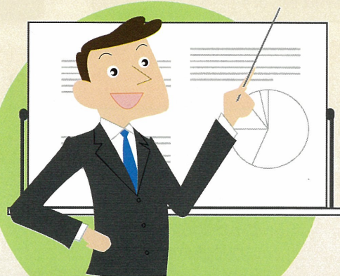
家庭教育講演会・相談会