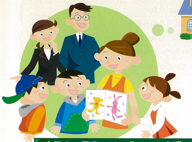
企業内の子育てサークルへの支援